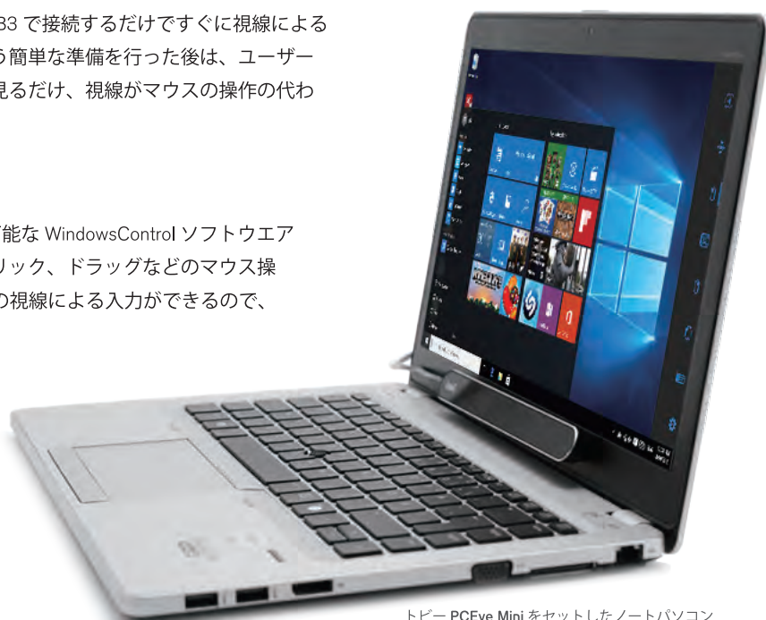
トビー PCEye Mini をセットしたノートパソコン

現在は他の入力方法でパソコン操作をしているユーザーも、このトビー PCEye Mini と組み合わせると操作が早く楽に行えます。これまで首や肩の痛み、操作スピードの遅さに悩まされていたパソコンユーザーもトビー PCEye Mini と組み合わせる事によって、より自然にリラックスしてより速くパソコン操作ができるようになります。