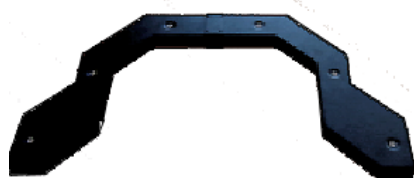
ソニウイング シミュレータ用 超音波センサ 6 個が埋め込まれています。