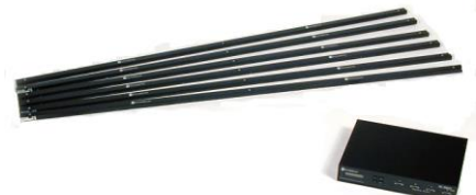
ソニストリップ 0.6m、1.2m、1.8m の 3 種類があり、 超音波センサが埋め込まれています。