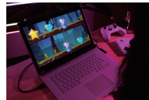
PCEyeMini用センサリーアイFX