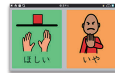
「基本文」を1x 2マスの設定で表示