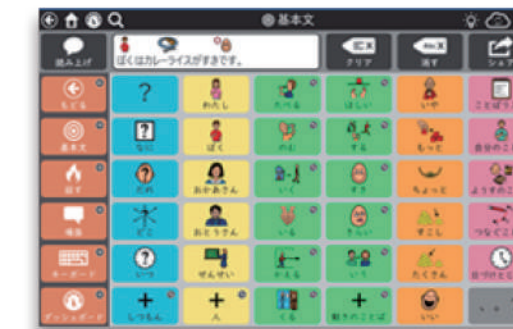
「基本文」を6 x 6マスの設定で表示