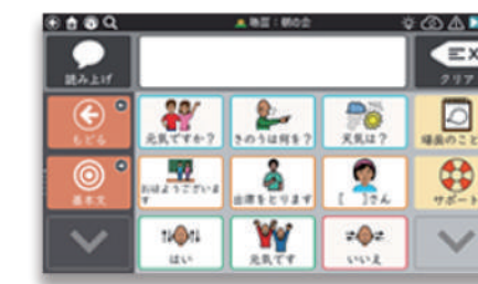
「場面」-朝の会を3x 4マスの設定で表示