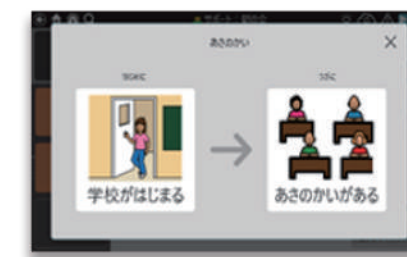
「サポート」-はじめに、つぎに を表示