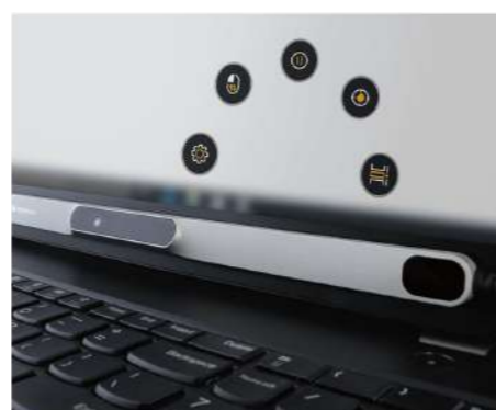
スクリーンキーボード、ゲーム用の設定、ネット検索を楽にするブラウザサポート機能などを備えています。

PCEye5には、TD Controlソフトウェアが付属しています。パソコンの経験がある方なら、TD Controlソフトウェアを使って通常のマウスの動き、例えば「ダブル左クリック」「左クリック」「右クリック」「スクロール」「拡大」などができ、通常のソフトウェアやインターネットなどのパソコン操作が可能です。