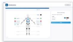
④ センサをとりつけます。