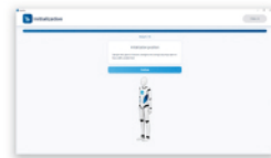
⑥ 測定前に基準姿勢をとります。