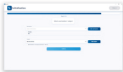
⑤ 作業内容と作業者を入力します。 ※匿名可