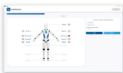
② センサとそのバッテリー残量を検出します。