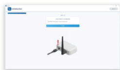
① レシーバを検出します。