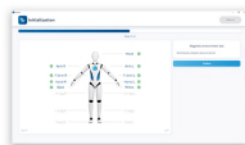
③ 磁気環境を検証します。